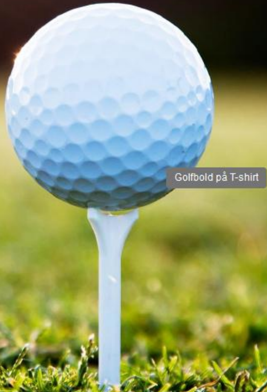
Golfbold på T-shirt